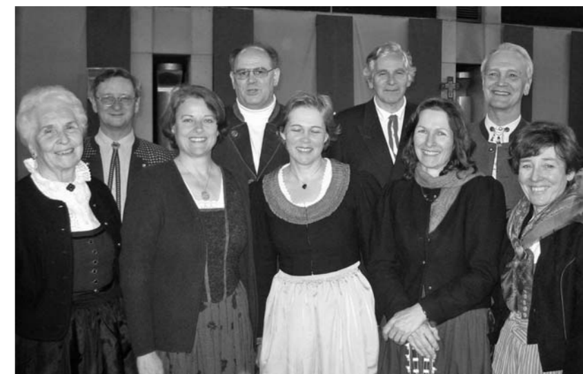
Wärmt die Herzen der Messbesucher: Hinterbrühls Volksliedchor