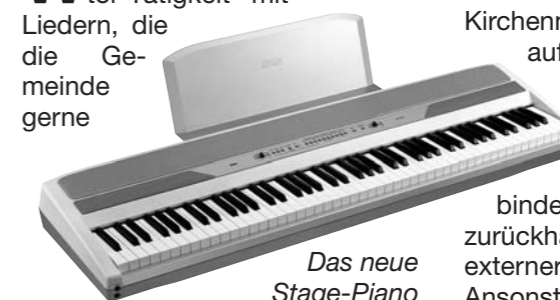
Das neue Stage-Piano

Wir sind auch dabei, die Kantor-Tätigkeit mit Liedern, die die Gemeinde gerne