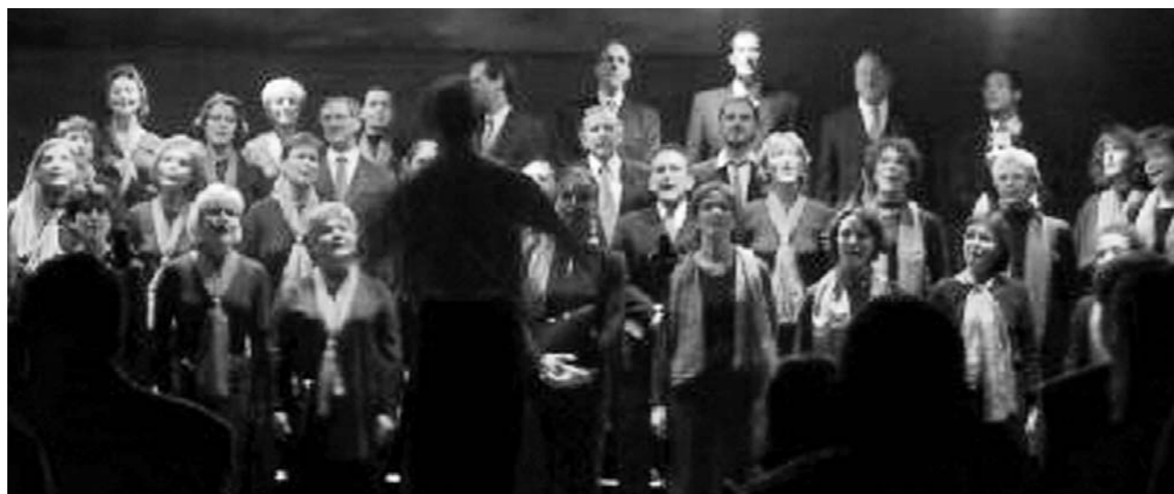
Sorgt immer wieder für Begeisterung und eine volle Kirche: Hinterbrühls Gospelchor „VOICE, REJOICE!“