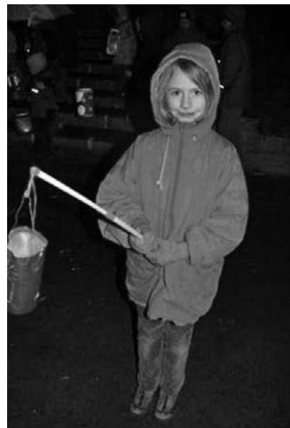
Martinsfest – Laternenfest: In der Südstadt ebenso wie im SOS-Kinderdorf Hinterbrühl (Bild)

ten Speisen an Ort und Stelle. Das Ergebnis: Ein Fest voller Heiterkeit – und die Aufbesserung des Kontostandes des Sozialkreises wird fast schon zum Nebenzweck, ist aber auch nicht zu verachten. Denn: So gut es uns auch geht – es gibt sie doch auch bei uns, die versteckte und verschämte Not. Wenn es nach Einbruch der Dunkelheit stimmungsvoll wird; die Kinder mit ihren Laternen zur Kirche wandern; die vertrauten Lieder zu hören sind; das Feuer lodert und Sankt Martin auf dem Pferd geritten kommt, um seinen Mantel mit dem Bettler zu teilen, dann gibt es Augenblicke von Glück und Rührung. Und mancher summt auf dem Heimweg „Laternenlicht verlass' mich nicht, rabimel, rabamel, rabum ...!“ G.B.