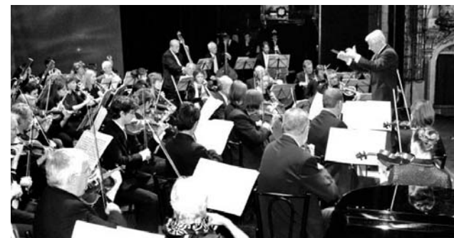
Mödlinger Symphonisches Orchester