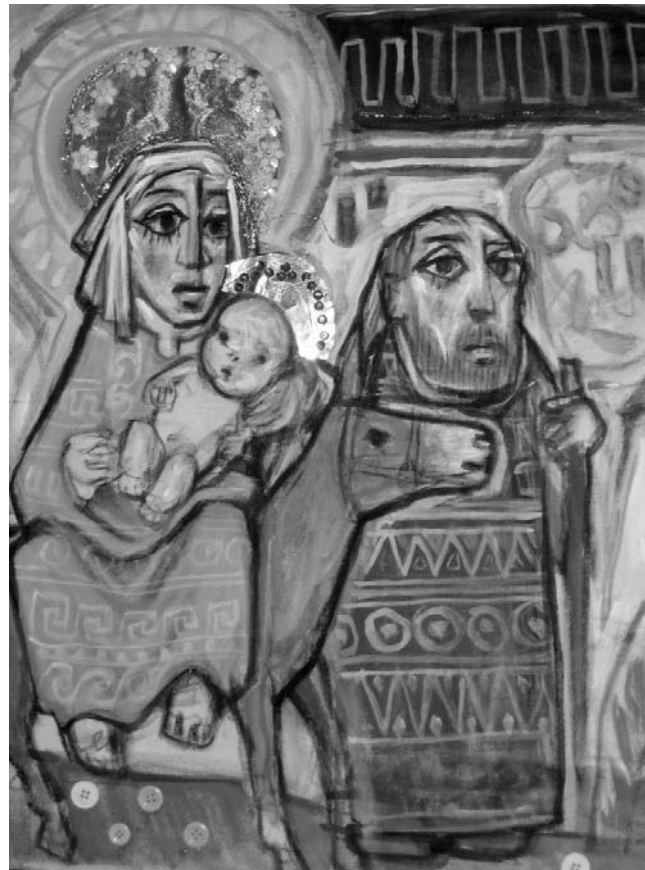
Kirchberger Fastentuch: Die Hl. Familie auf der Flucht

In den Evangelien bleibt Jesus immer auch Mensch, ein frommer Jude, der aber aus der Kraft Gottes und mit einer Macht spricht und lebt, so dass die Menschen das große Geheimnis, das wir in theologischer Sprache „Menschwerdung“ nennen, erahnen.