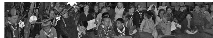
Viel Jugend umlagerte bei der Pfadfindermesse den Altar