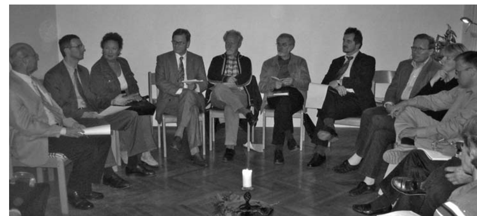
Dem Pfarrer zur Seite gestellt: Pfarrgemeinderat – hier in Hinterbrühl