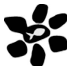
Das Logo der Pfarrgemeinderatswahlen

guten Besuch fest und staunen über die lockere Atmosphäre bei den Gottesdiensten und über die aktive Beteiligung der Anwesenden. Dieses gute Zeugnis darf uns nicht darüber hinwegtäuschen, dass unsere Gemeinde katholischer Christen um ein vieles größer ist als jene, die wir Sonntag für Sonntag zu Gesicht bekommen. Und wir stellen auch schmerzhaft fest, dass sich Jugendliche und oft schon Kinder aus unserem Gemeindeleben zurückziehen.