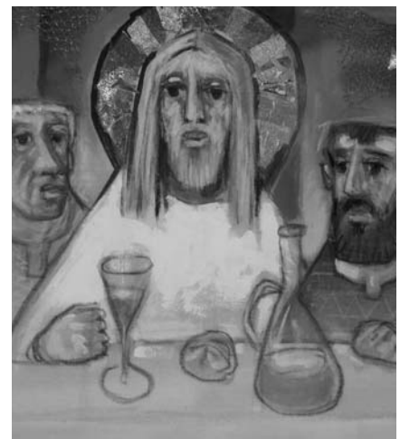
Aus dem „Letzten Abendmahl“, Kirchberger Fastentuch

Alle Diskussionen, wie Gott in Brot und Wein präsent ist oder wer „in persona Christi = an Christi Statt“ handelt, gehen an der Absicht Gottes vorbei. Gott hat durch Jesus den glaubenden Menschen die Eucharistie zur Nahrung und Stärkung geschenkt – darum gehören alle christlichen Kirchen an den gemeinsamen Tisch.