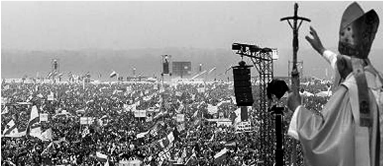
Weltjugendtag in Köln: Mehr als eine Million junger Christen waren gekommen – und Papst Benedikt XVI. überraschte viele Beobachter mit seiner – im Gegensatz zu seinem Vorgänger – auffallenden persönlichen Zurückhaltung. Ist die Kirche dabei, die Gabe des Zuhörens (siehe Leitartikel unten) zu lernen?